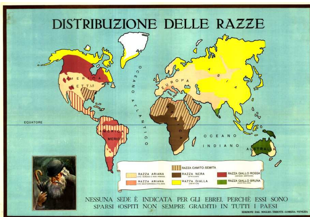
“Distribuzione delle razze”, Trieste-Gorizia-Venezia, Edizioni Dal Soglio, senza data di stampa (circa fine 1938 – inizio 1939)