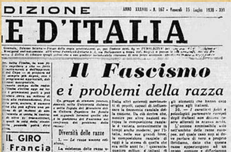
Il Manifesto degli scienziati razzisti, 15 luglio 1938