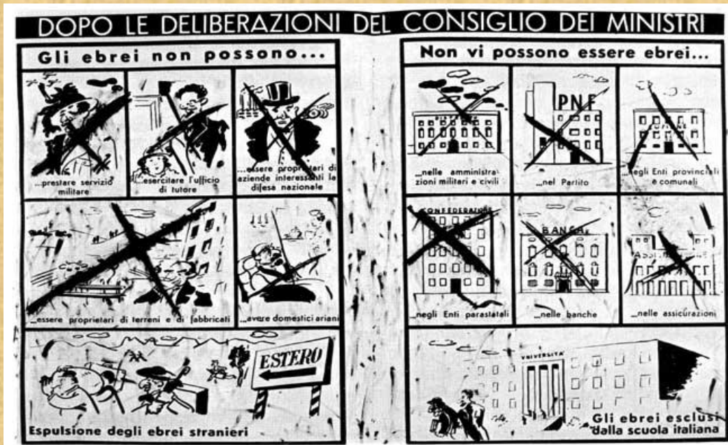
La difesa della razza, novembre 1938