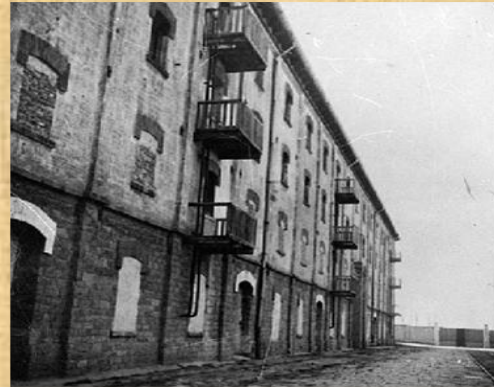
Scheda carceraria di Regina Coeli